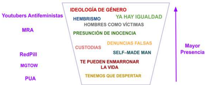
Figura 4: Presencia de discursos e ideas clave de la manosfera (con correspondencia a sus subculturas) con presencia en los grupos de discusión conducidos con varones jóvenes españoles.

En torno a los Gurús de la Seducción, pese a que alguno conocía a Mario Luna y Álvaro Reyes, no había demasiado rastro que hablase de la seducción como un juego a aplicar, o una inversión o el consentimiento de ellas como un final boss que superar, así como tampoco rastros de discurso biologicistas sobre la sexualidad. Así como se puede percibir en la etnografía, parece que todo el discurso de los Gurús de la Seducción ha perdido bastante sentido en España, en gran parte por la última eclosión del movimiento feminista, siendo que ese público y maestros se han ido acercando a un discurso más neoliberal y relacionado con las inversiones en criptomonedas, NFTs e inversiones de riesgo, con una lógica muy parecida de ofrecerte una metodología con la que ser un hombre exitoso.