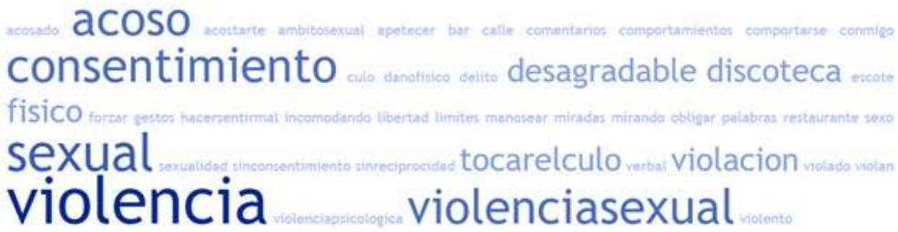
Figura 5: Nube de palabras creada a partir de la definición de violencia sexual dada por los participantes de los grupos de discusión en la que podemos visualizar las concepciones y creencias más recurrentes.

Sin embargo, en la mayoría de los participantes encontramos una identificación recurrente entre el término violencia sexual y la violación. Como se ve en la nube de palabras creada a partir de las respuestas de los participantes, cuando se les pregunta a los hombres jóvenes qué es violencia sexual aparece con fuerza la idea de que la violencia sexual es la violación y de que la violencia es física o que supone un daño físico. En algunos de los grupos de discusión emerge la creencia de que la violencia sexual suele ser física, como explica uno de los participantes: