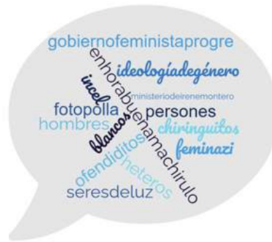
Figura 3: Nube de palabras con los términos de la manosphere que hemos detectado en el habla de los participantes en los grupos de discusión.

creadores de contenido de la manosphere y que han sido utilizados por los participantes de los grupos de discusión sin ser directamente preguntados por estos términos. Algunos de estos términos son: ideología de género, feminazi, chiringuito feminista o seres de luz.